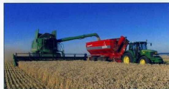
Překládací nástavba HTS 22.79 v Agroservisu Višňové