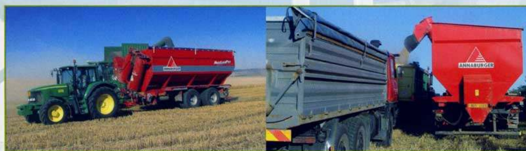
Nástavba překládacího vozu