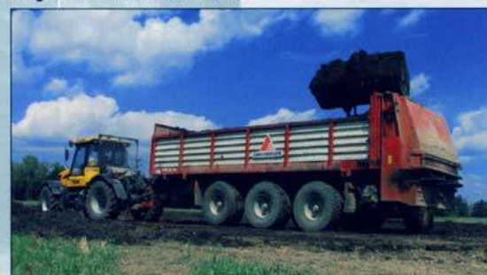
Podvozek s rozmetadlem HTS 29.79 v ZS Skalsko s.r.o.