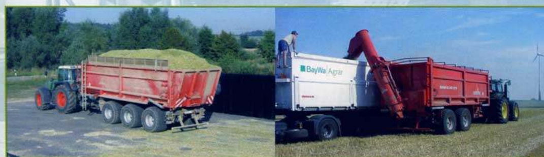
Nástavba Schubfix – výtlačné čelo

Nástavba senážního vozu je nasazena při sklizni travní a vojtěškové senáže a silážní kukuřice jen několik týdnů v roce. Oproti jednoúčelovému stroji lze snížit pořizovací náklady na polovinu.