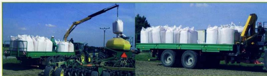
Nástavba univerzální plošina