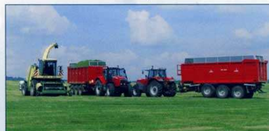
Třínápravové výměnné systémy HTS 29.79 používají v Agro Měřín a.s.