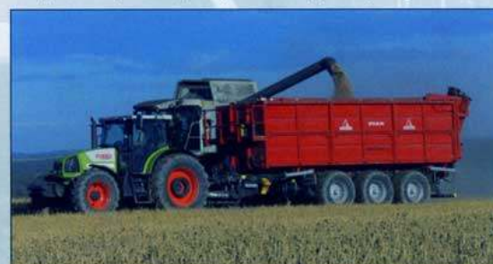
Třínápravový výměnný systém HTS 29.79 s překládacím šnekem v Agroslužbách Žďár nad Sázavou