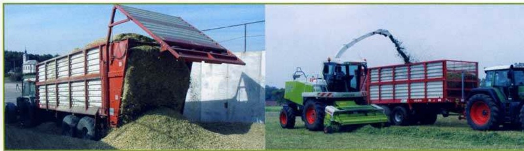
Nástavba senážní vůz